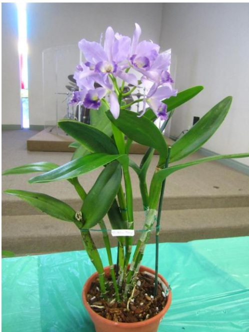
Cattleya Blue Boy