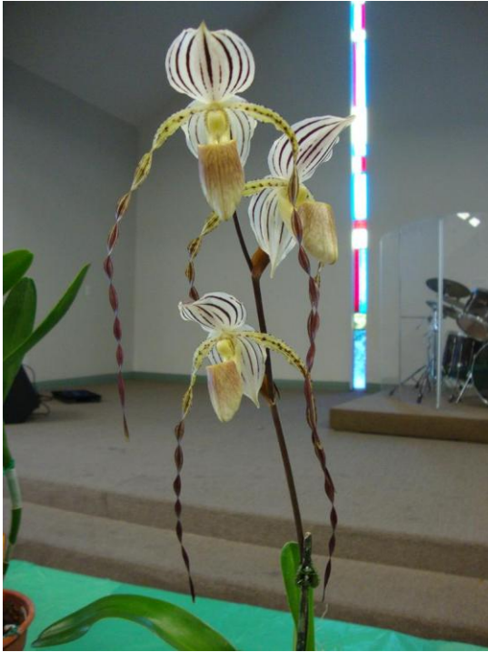
Paph. Mt. Toro