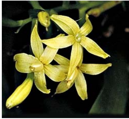
Ảnh: Orchid Species