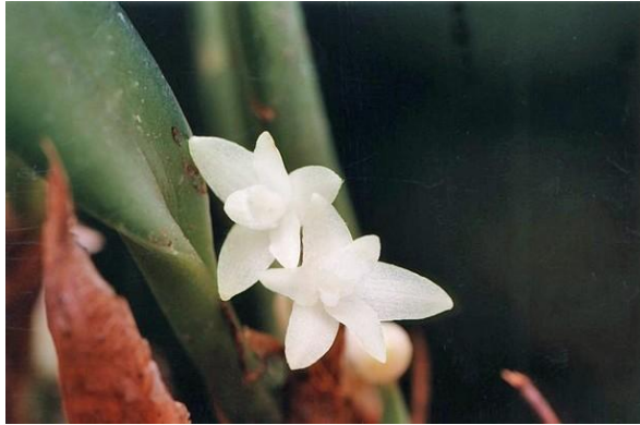
Ảnh: Alex & Karel Petrzelka

Đồng danh: Eria tonkinensis Gagnep. 1930