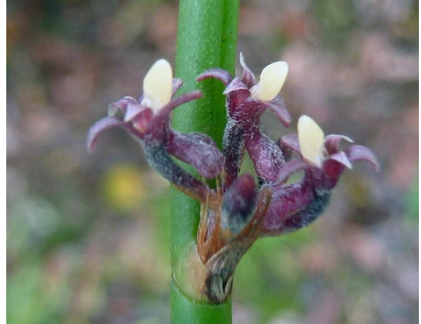
Ảnh: Trương Bá Vương