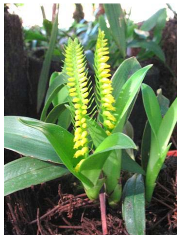
Ảnh: Đinh văn Tuyên

Đồng danh: Cryptochilus farreri Schltr. 1924.