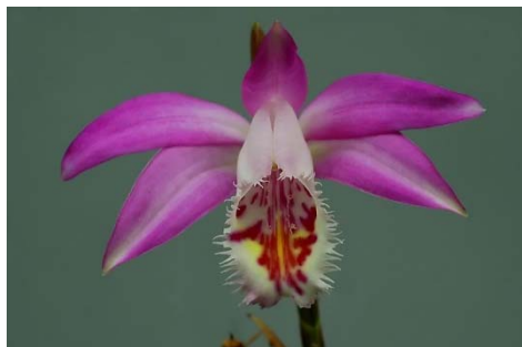
Ảnh: Orchid species

Đồng danh: Pleione × harberdii Braem 1999; Pleione × moelleri Braem 1999; Pleione × mohrii .