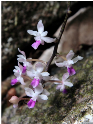
Ảnh: Orchid species

Đồng danh: Sarcanthus smithianus Kerr 1933.