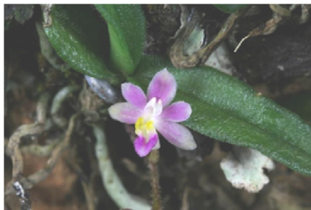
Ảnh: Orchid species