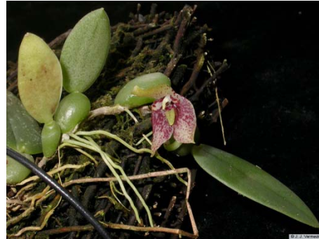
Ảnh: Orchid species