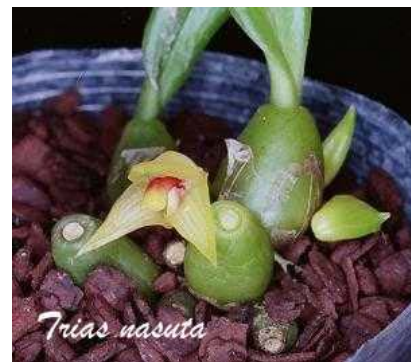
Ảnh: Orchid species