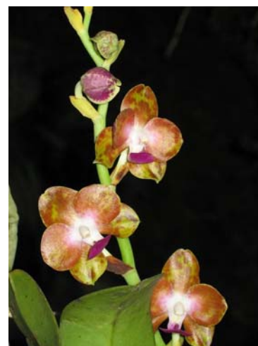
Ảnh: Lê trọng Châu