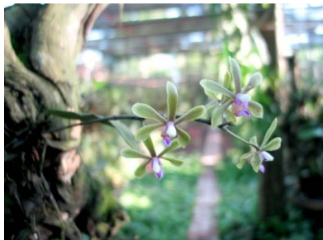
Phalaenopsis braceana