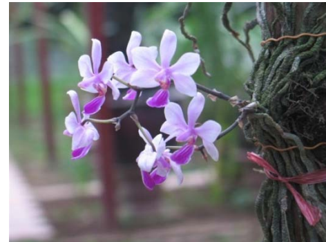
Phalaenopsis honghenensis

Cả 3 cây này đều nhỏ, hoa có hình dáng giống nhau. Nếu căn cứ vào 3 tấm ảnh trên đây chúng ta có thể phân biệt được ngay, vì cây Phal. braceana hoa màu xanh, nhưng màu sắc trong ảnh đôi khi cũng không trung thực và chỉ là một phần để xác định mà thôi, nhất là cây Phal. braceana có nhiều màu khác nhau như sau.