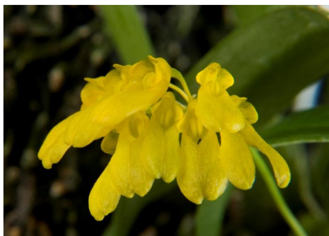
American Orchid Society