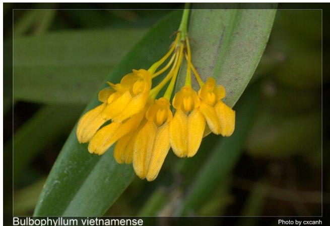
Chu Xuân Cảnh