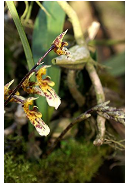
Bulbophyllum sp. Đình Văn Tuyên

Thông thường các vườn lan thương mại tại Hoa Kỳ, vườn nào cũng có vài giống lan này, nhất là những tay chơi lan lâu năm hoặc sưu tầm lan rừng. Đây là một loài lan đang làm cho các nhà thực vật học nhức đầu nhất để phân nhóm, hiện thời loài này được chia thành 120 nhóm và việc đặt tên cho cây rất phức tạp vì hình dáng của thân củ, hoa lá, mùi hương, màu sắc hoàn khác nhau. Vì vậy tôi nghĩ, nên đặt tên cây này là Thiên Dạng Kỳ Lan như vậy có lẽ phù hợp với tính cách đa dạng của loài lan này.