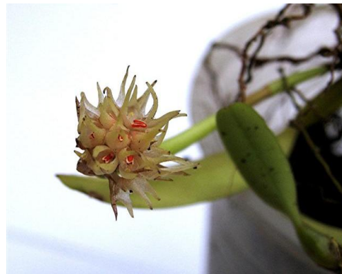
Bulb. odoratissimum Nguyễn Vũ Khôi

hoa, có giống ra tới 40-50 hoa nhỏ. Hoa trên cành riêng rẽ, đối nhau, xòe vòng tròn như cánh quạt, hay cuộn xoắn tròn và khít xếp chồng lên nhau như trái khóm, hay giống như một quả dâu Bulb. repens . Hoa có nhiều dạng như 2 cánh ngoài dưới mà mở rộng thì nhìn giống như con nhện hoặc bọ cạp Bulb. lobii trong tư thế kinh địch. Còn mùi hương, kích thích, và màu sắc đều khác nhau, nhưng xuống, khi hoa bị rung động để gây sự chú ý cho người xem hay loài ruồi nhặng. Không giống các loài lan khác dùng hương thơm ngọt và màu sắc sặc sỡ để chinh phục ong và bướm, phần nhiều loài cây này lại thích dùng ruồi và bọ hung để làm công việc thụ phấn di truyền nòi giống. Vì vậy, nhiều cây lan tinh quái có màu đậm tối, và mùi khó thở ta nên cảnh giác khi ta tới gần như Bulb. odoratissimum hay Bulb. careyanum .