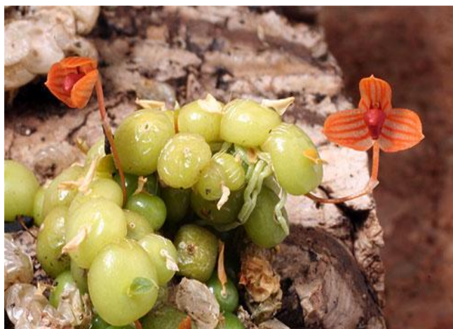
Bulb. minitissimum www.Orchidaceae.net

Lan Bulbophyllum có đặc điểm chung là thường mọc từng củ đơn rời sinh sản theo đường thẳng nối tiếp nhau đôi lúc nhìn giống như một hàng quân