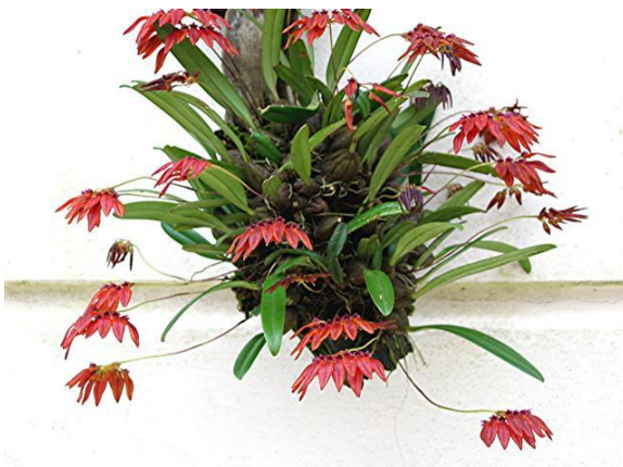
Bulbophyllum sp. Lê Trọng Châu