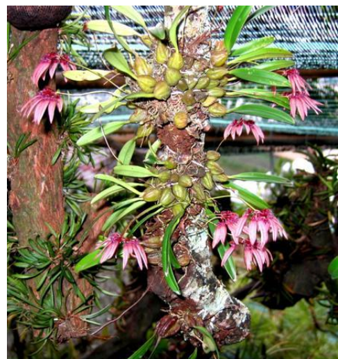
Bulbophyllum sp. Lê Trọng Châu