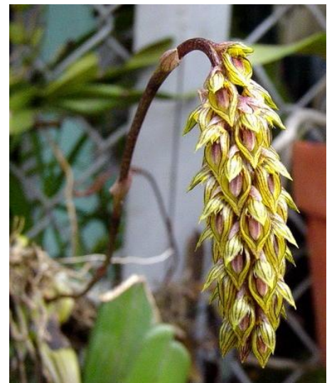
Bulb. cariniform Huỳnh Hậu