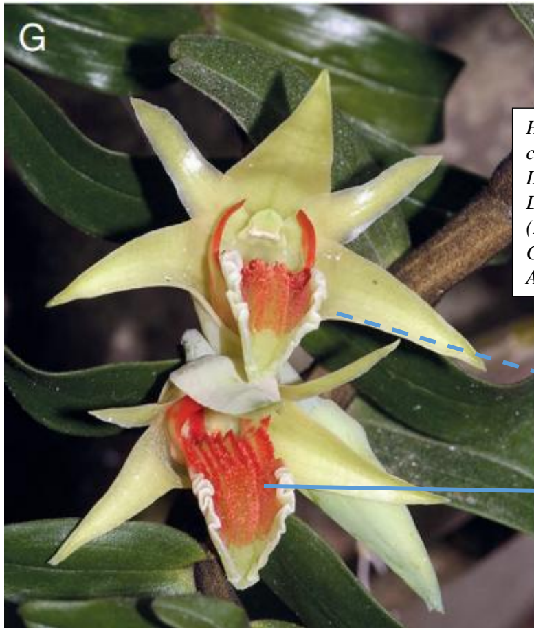
Hình bên: Dendrobium suzukii được chụp ngoài tự nhiên bởi Dr. Nông Văn Duy (Hình từ bài A survey of Dendrobium Sw. sect. Formosae (Benth. & Hook.f.) Hook.f. in Cambodia, Laos and Vietnam của Averyanov et al. 2016)

Hai loài này rất là giống nhau, tuy nhiên có những đặc điểm có thể phân biệt được giữa 2 loài này được đề cập trong bài viết về cây Den. suzukii : (1) Hoa to lớn hơn, (2) Thể chai gần như tròn ở phần gốc của môi hoa, (3) Có 5 đường lồi trên môi hoa ( Den. cruentum có 3), (4) Vành mép thùy giữa của môi rất là gọn sóng, (5) Thể chai trên môi hoa là những đường (trong khi đó Den. cruentum là mảng chai lớn với những đốm thịt ở giữa môi hoa).