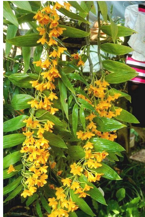
Ảnh của Tô Quang Hợp, Điện Biên Phủ