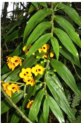
Dendrobium chrysanthum