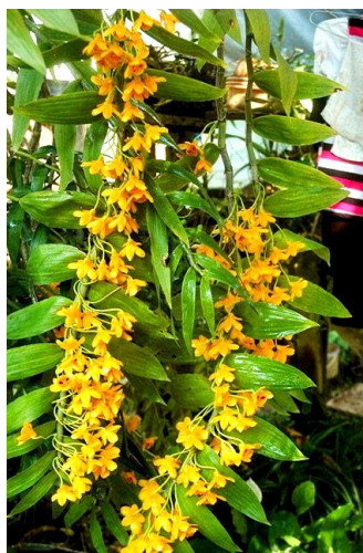
Dendrobium chrysanthum