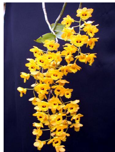
Dendrobium fimbriatum