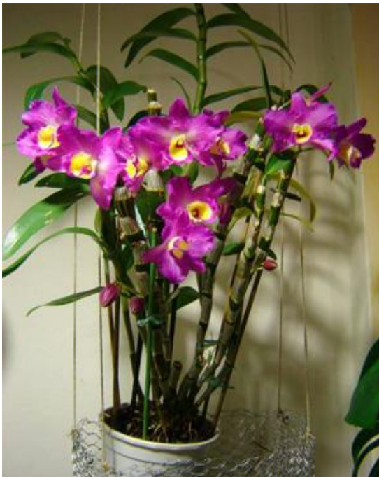
Dendrobium nobile var. elegans www.orchids.it