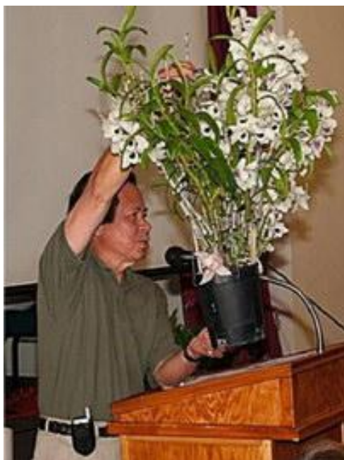
Nguyễn Hưng Yên

Dendrobium nobile là một giống lan không thể thiếu trong bộ sưu tập hoa lan của chúng ta, xin hãy cố gắng nuôi một cây tối thiểu cũng phải như hình dưới đây.