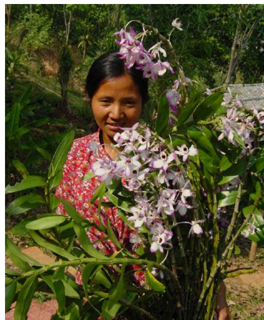
Dendrobium nobile var. luxurians