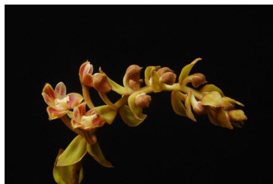
Ảnh: Chu Xuân Cảnh