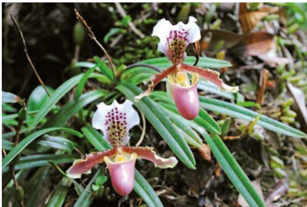
Trần Tuấn Anh

Chúng tôi không hiểu tại sao 2 cây lan khác nhau đến như vậy mà lại cho là cùng loài, cùng giống?