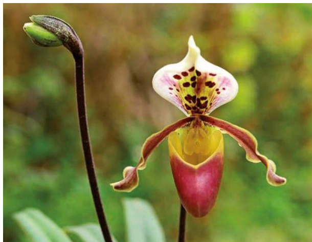
Chu Xuân Cảnh