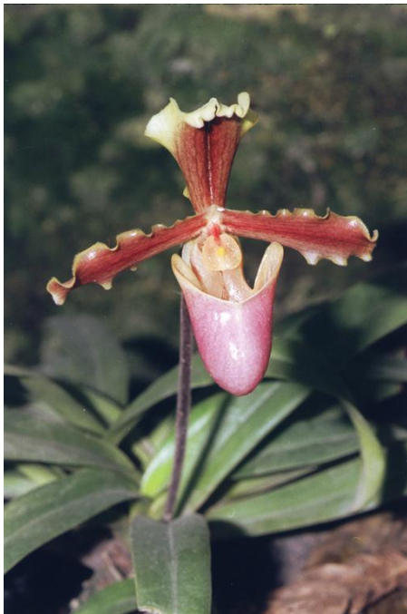
Paphiopedilum x trantuanii

Sau đó cây lan hải Trantuanii xuất hiện tại các vườn bán lan ở Việt Nam. Đặc biệt anh Chu Xuân Cảnh đã đưa nhiều hình ảnh của cây này lên các trang mạng.