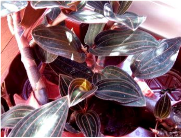
Anct. setaceus

Sau đây, chúng tôi xin trình bày một số hình ảnh để quý vị cùng nhận thức, nhất là quý vị ở quê nhà có thể tìm ra những loài lan chúng ta chưa từng để ý đến.