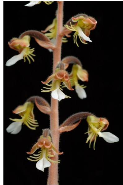
Hoa Anct. setaceus orchidphoto.org