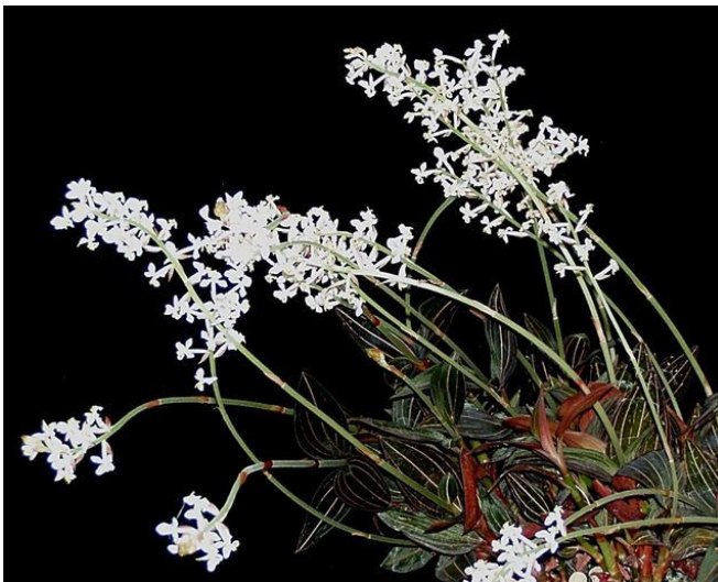
Ludisia discolor