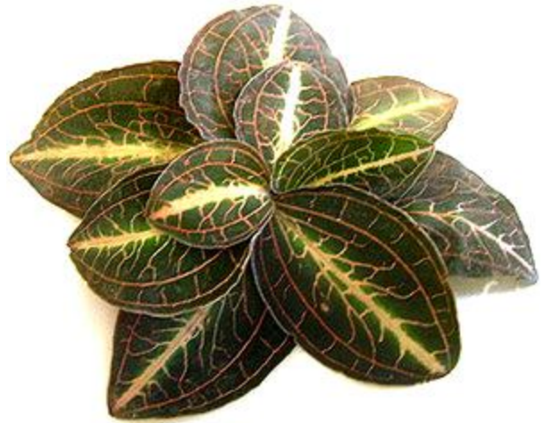
Anct. roxburghii