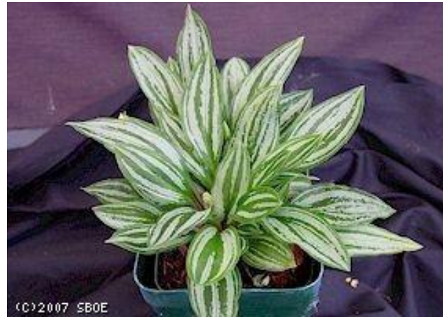
Cyclopogon lindleyanum