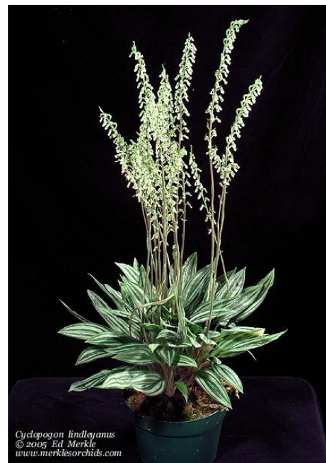
Cyclopogon lindleyanum Hình: merkleorchids.com

Tuy rằng hoa nhỏ, nhưng nhìn kỹ 2 tấm hình kể trên hoa lá cũng khá hấp dẫn đấy chứ?