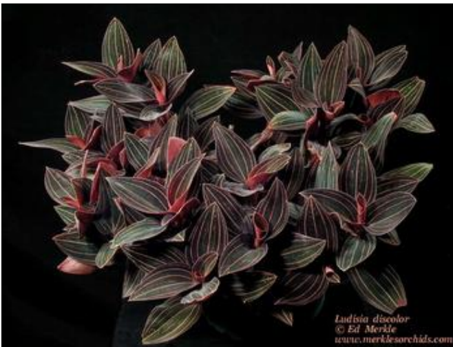
Ludisia discolor