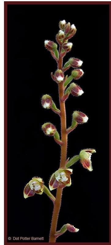
Macodes petola