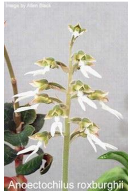
Anct. roxburghii