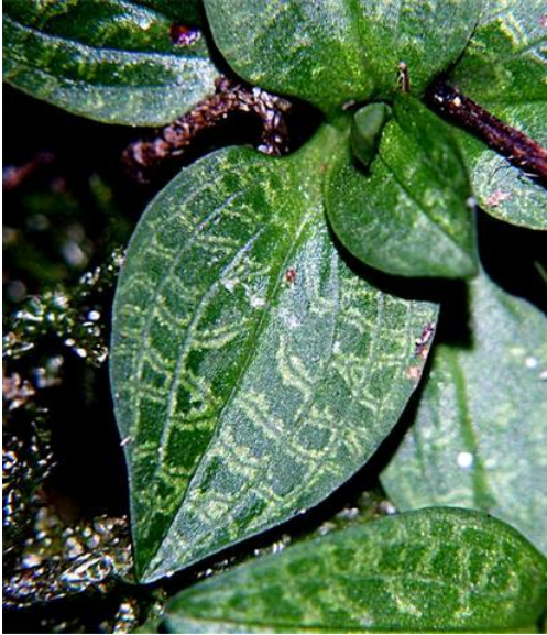
Godyera repens