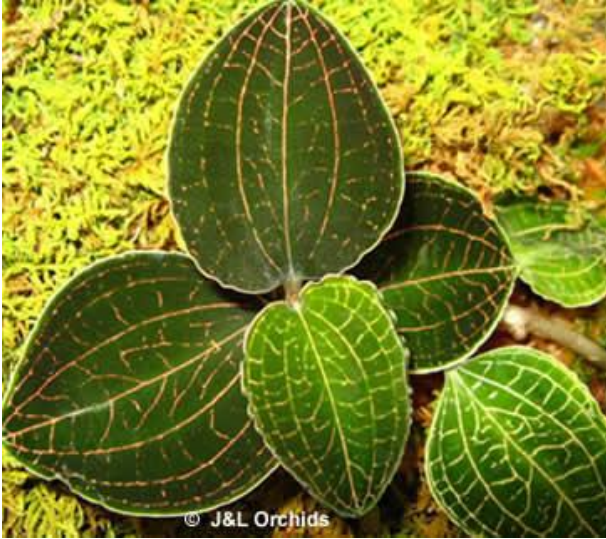
Anct. roxburghii