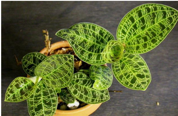
Macodes petola