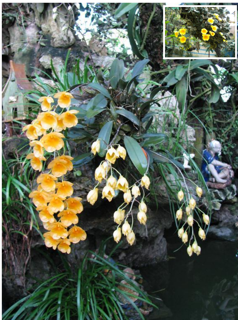
Westminster mùa lan hoàng thảo nở Bùi Xuân Đáng

Hy vọng rằng với hình ảnh của các cây lan và lời phân tích kể trên sẽ giúp các bạn nhận diện mấy cây lan này dễ dàng hơn.