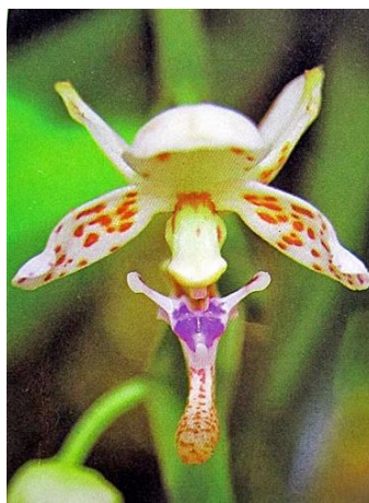
Ảnh: Lan Hoang dã Phú Quốc