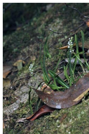
chụp tại Hòn Bà Khánh Hoà ngày 29-11-2014

Với 2 cây này tổng số các giống lan nguyên thuỷ (species) sẽ lên tới 1159, tuy nhiên trong số này còn nhiều nhầm lẫn vì các tài liệu viện dẫn đã xưa cũ không xác thực và có thể chỉ là đồng danh mà thôi, nhưng chưa ai tìm ra những sai lầm đó.