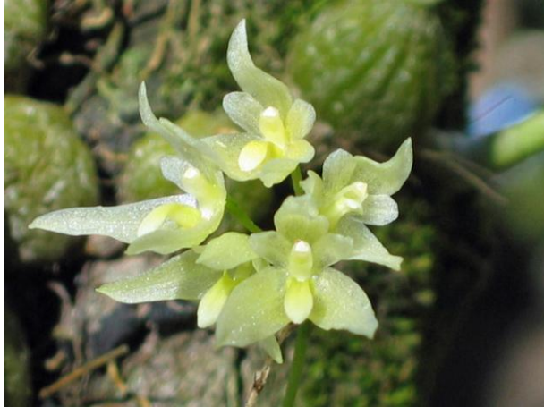
Lê Trọng Châu

Đồng danh: Biermannia bimaculata (King & Pantl.) King & Pantl. 1898.