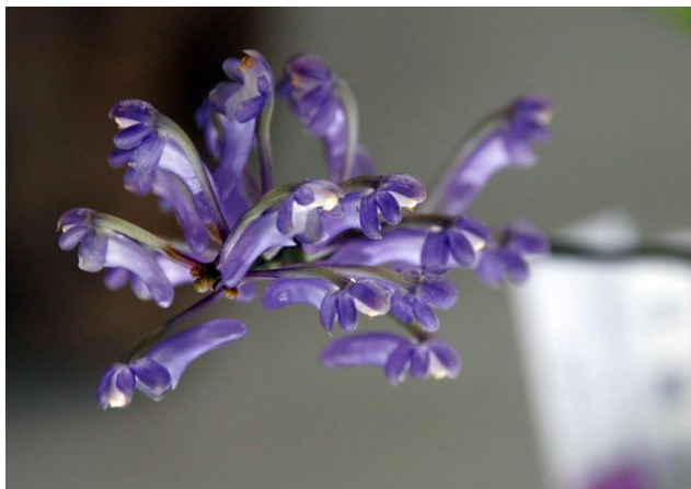
Cleisocentron abasii