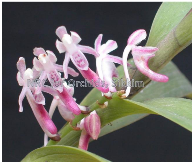
Cleisocentron pallens orchidspecies.com

Ngoại trừ mấy cây có hoa màu hồng và cây Cleisocentron abasii , mấy cây Cleisocentron gokusingii , Cleisocentron kinabaluense và Cleisocentron merrillianum hoa lá rất giống nhau, khó lòng phân biệt.