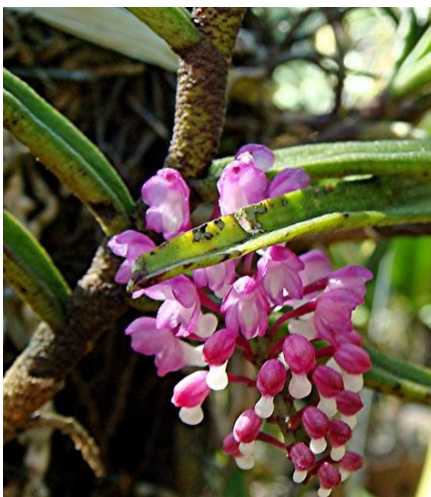
Cleisocentron klossii Bùi Xuân Đáng