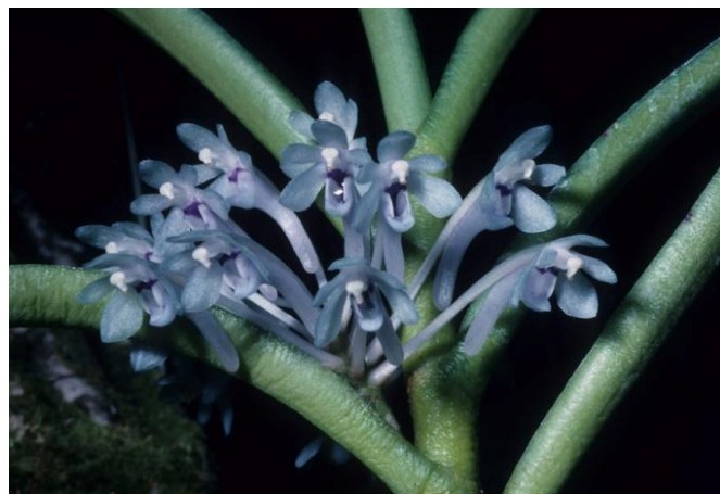
Cleisocentron merrillianum orchid.unibas.ch