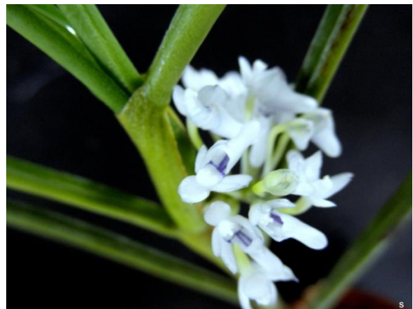
Cleisocentron kinabaluense orchidsforum.com