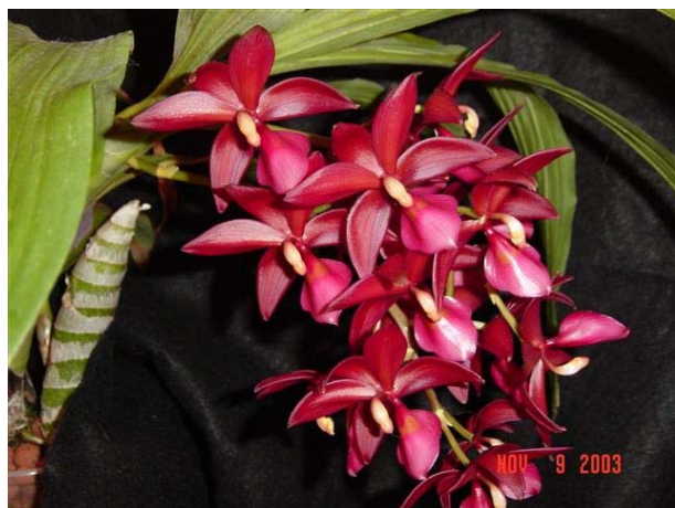
Cynoches Wine Delight 'Jem'

Những giống Cycnoches thông thường đã lạ đẹp. Nhưng những cây lai giống giữa những cây Cycnoches , Catasetum và Mormodes lại còn tạo ra nhiều giống lạ đẹp hơn nữa như cây Cycnoches Wine Delight = ( Cycnoches lehmanii x Mormodes sinuata ).