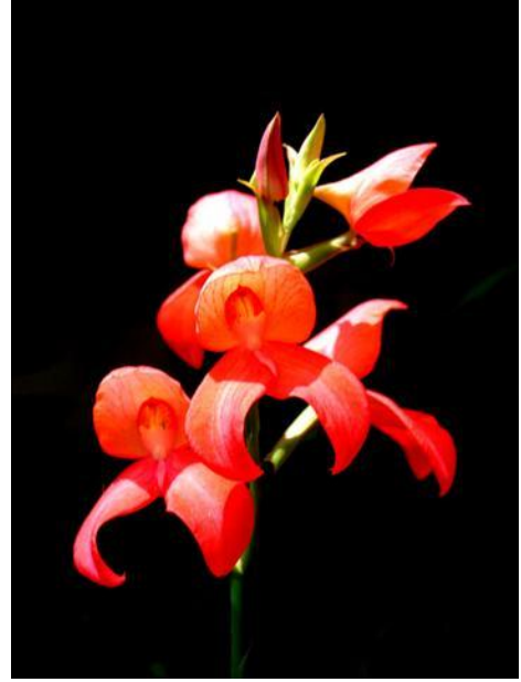
Disa Kirstenbosch Pride