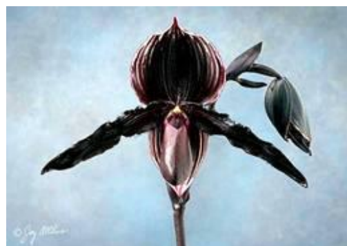
Paphiopedilum Krull's Black Shadow 'Crystelle'

Ngày 22 tháng 9, năm 2007, các giám khảo thuộc chi bộ West Palm Beach thuộc Hội Hoa Lan Hoa Kỳ đã trao giải FCC/AOS với 90 điểm cho cây lan Paphiopedilum Krull's Black Shadow 'Crystelle', lai giống giữa cây Paph. Ruby Mist x Paph. rothchildianum .