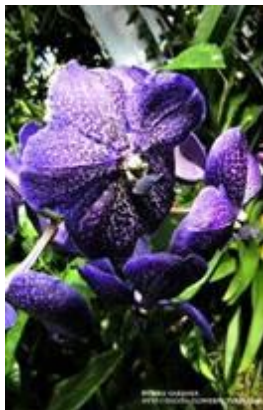
Vanda Trevor Rathbone 'Banjong'

Kể ra còn nhiều nữa và những cây này đâu có thể gọi là huyền lan được chứ.