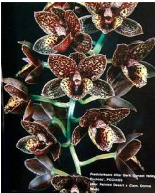
Fredclarkeara After Dark ‘Sunset Valley Orchids’ FCC/AOS

Fredclarkeara After Dark ‘SVO Black Pearl’ FCC/AOS (Mo. Painted Desert ‘Sunset Valley Orchids’ HCC/AOS x Ctsm. Donna Wise ‘Kathleen’ AM/AOS)