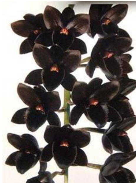
Fredclarkeara After Dark ‘SVO Black Pearl’ FCC/AOS