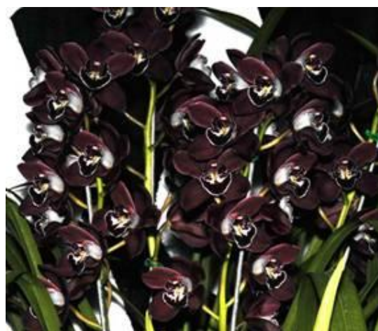
Cymbidium Ruby Valley 'Emperor'

Những nhà chuyên môn lai tạo giống lan đầu có chịu đựng tay, nhờ vào kỹ thuật phân tích và sự kiên tâm bền chí họ đã tạo những bông lan có thể gọi là huyền lan được nếu chúng ta không quá khó tính.