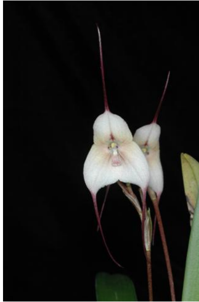
Dracula incognita www.orchidspecies.com