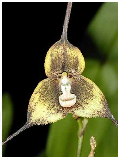
Dracula christineana