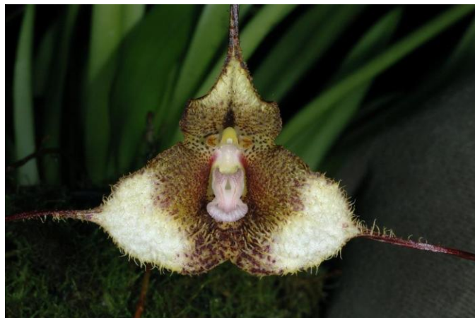
Dracula exasperata www.orchidspecies.com