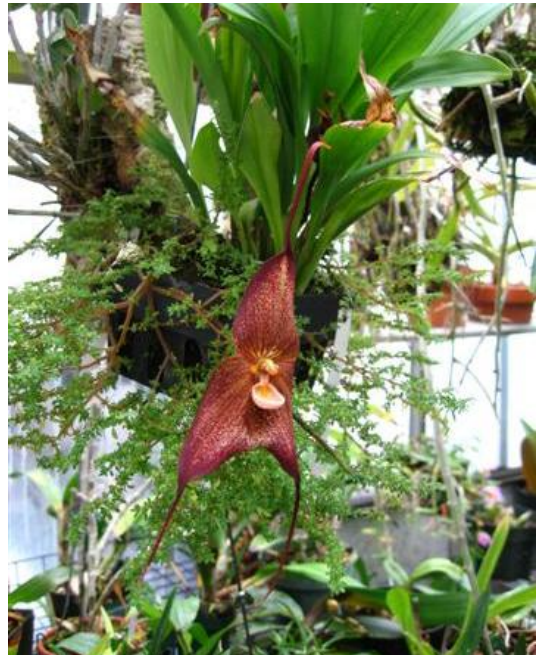
Dracula polyphemus 'Angel' AM/AOS Bùi xuân Đáng