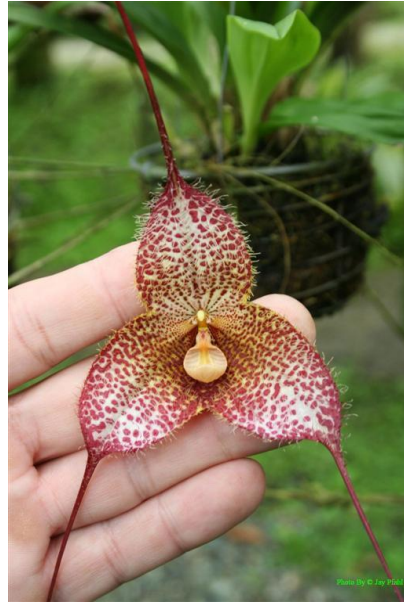
Dracula ligiae www.orchidspecies.com