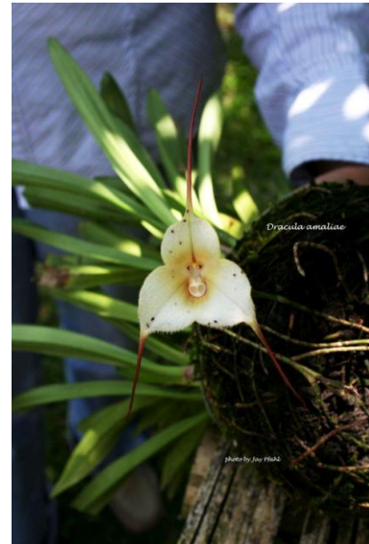
Dracula amaliae www.orchidspecies.com