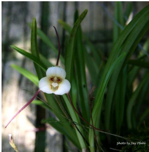
Dracula lotax www.orchidspecies.com