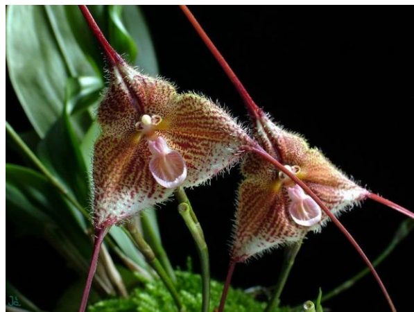
Dracula diana www.orchidspecies.com