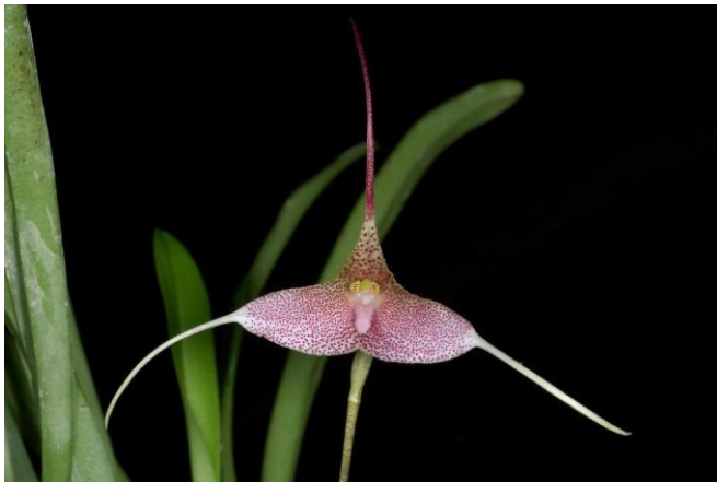
Dracula berthae www.orchidspecies.com