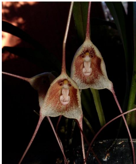
Dracula carlueri www.orchidspecies.com