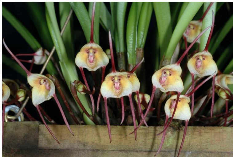
Dracula citrina www.orchidspecies.com