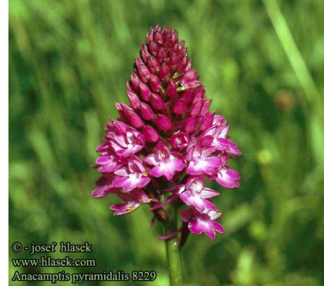
Anacamptis pyramidalis 8229