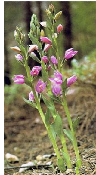
Cephalanthera kurdica