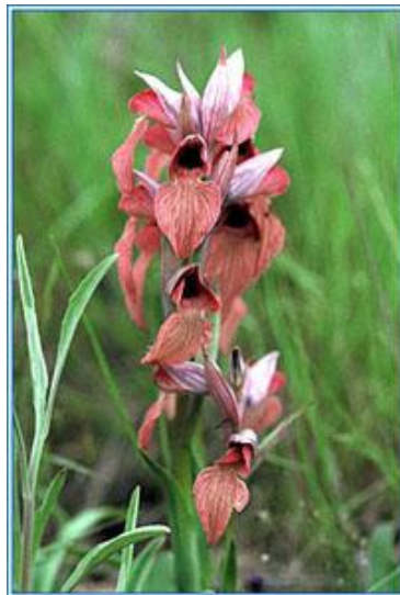
Serapias cordigera www.delfinadearaujo.com