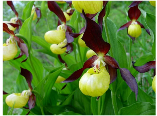
Cypripedium calceolus www.valletena.com