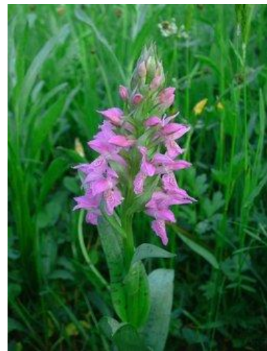
Dactylorhiza majalis