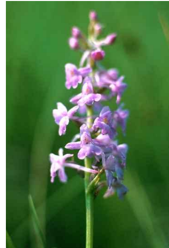
Gymnadenia odoratissima www.e.lst.se