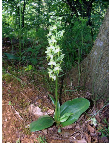
Platanthera chlorantha