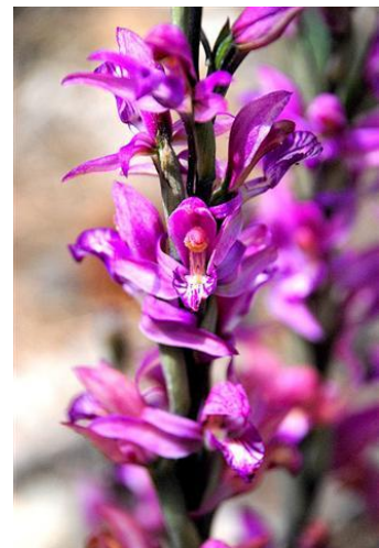
Limodorum abortivum www.ubcbotanicalgarden