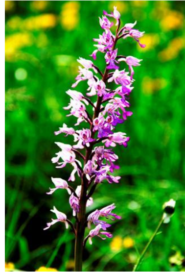
Orchis militaris www.dr-koch-reisen