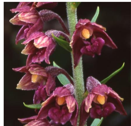
Epipactis atrorubens www.habitas.org.uk