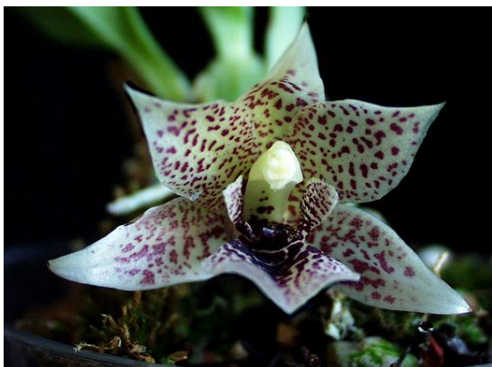
Prom. rollisonii

Phần lớn các giống Promenaea đều có màu vàng thẫm hay vàng nhạt có đốm hoặc có vân, do đó những cây lai giống đều cho hoa rất đẹp.