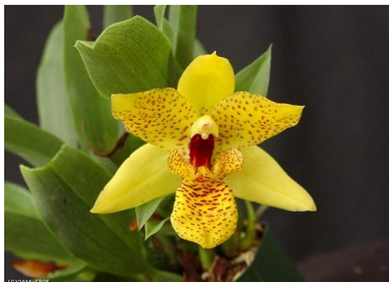
Prom. Colmaniana