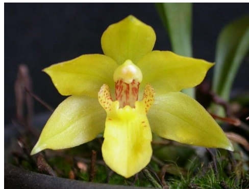
Prom. xanthina

Phần lớn các giống Promenaea đều có màu vàng thẫm hay vàng nhạt có đốm hoặc có vân, do đó những cây lai giống đều cho hoa rất đẹp.