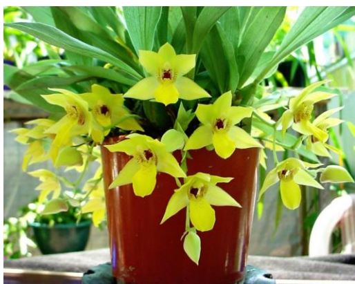
Prom. ovatiloba x Prom. xanthina