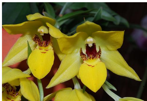
Prom. Limelight x Prom. citrata