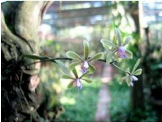
Phalaenopsis braceana