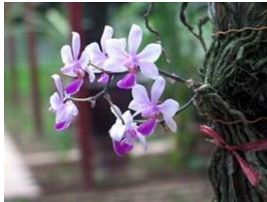
Phalaenopsis honghenensis

Cả 3 cây này đều nhỏ, hoa có hình dáng giống nhau. Nếu căn cứ vào 3 tấm ảnh trên đây chúng ta có thể phân biệt được ngay, vì cây Phal. braceana hoa màu xanh, nhưng màu sắc trong ảnh đôi khi cũng không trung thực và chỉ là một phần để xác định mà thôi, nhất là cây Phal. braceana có nhiều màu khác nhau như sau.