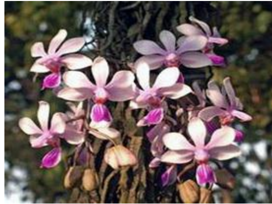
Phalaenopsis wilsonii