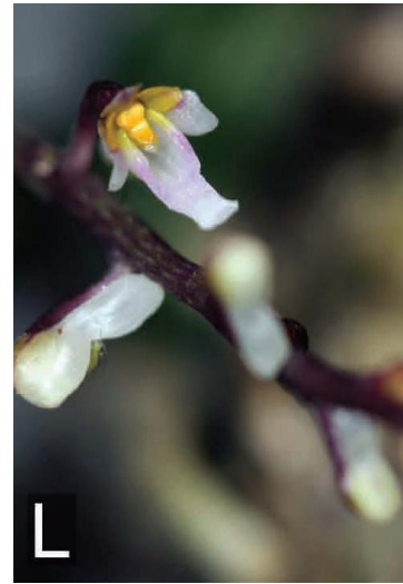
Ảnh: Nông Văn Duy &amp; Leonid Averyanov