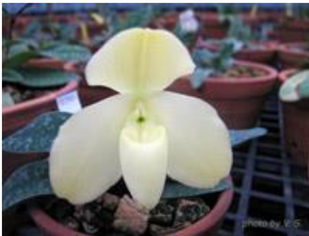
Paph.concolor f. album

Paphiopedilum concolor var. tonkinense (God.-Leb.) Pfitzer 1903