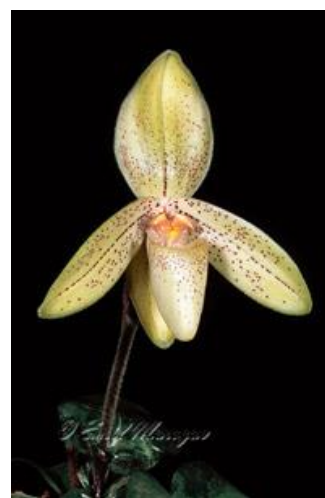
Paph. concolor var. striatum