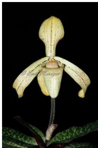
Paph. concolor var. longipetalum