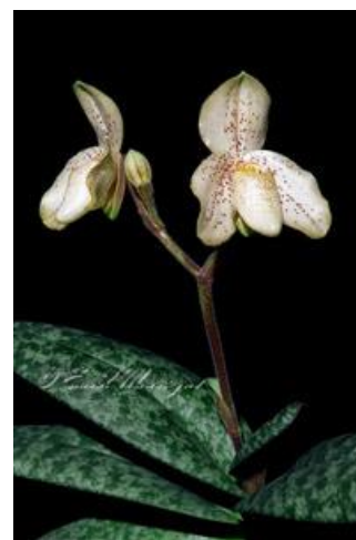
Paph.concolor f. hennisianum