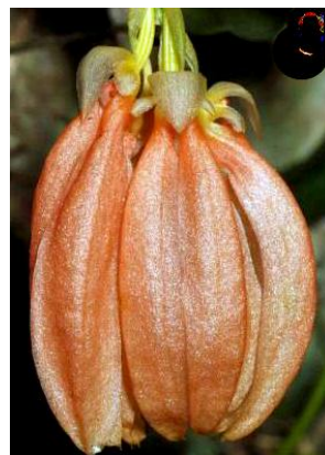
Ảnh: Leonid Averyanov