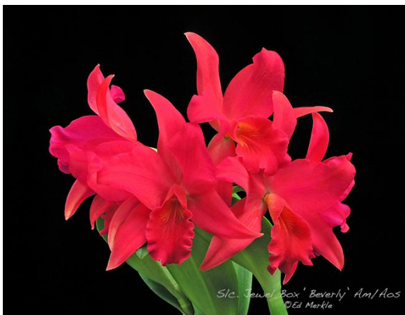
Slc. Jewel Box