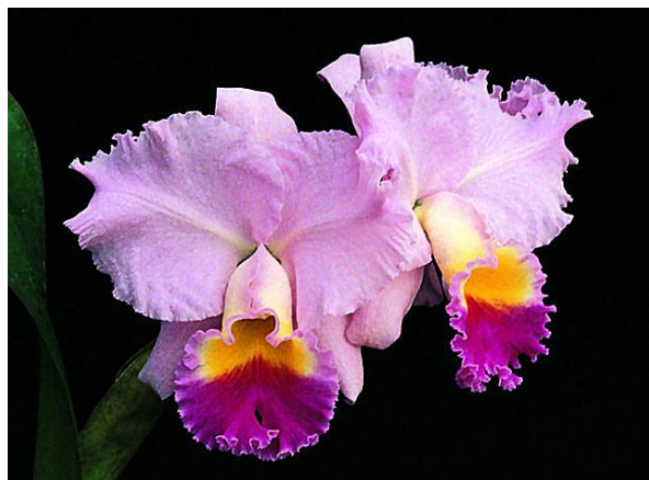
C. Horace WordPress.com