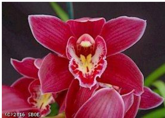
Cymbidium Carisona 'Glendessary'

Nhờ vào khí hậu thích hợp của miền nam California, nên các vườn lan ở Santa Barbara như Dickinson, Carpentier, Bryce, Everett, Rogers và Armacost & Royton ở Los Angeles có nhiều cây lan Kiếm được nhập vào trước chiến tranh và cây Cymbidium Lillian Stewart là hậu duệ của cây Cymbidium Carisona 'Glendessary' được dùng cho việc lai giống và sản xuất nhiều cây lan Kiếm đẹp đẽ.