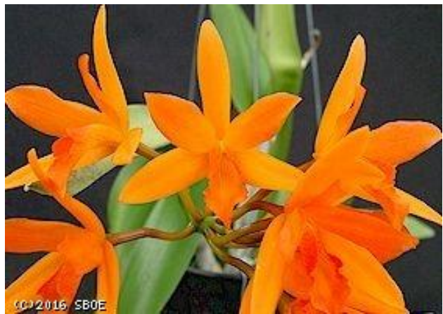
C. Trick or Treat