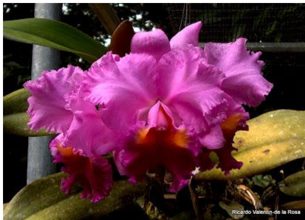
C. Drumbeat ricardogupi.blogspot.com