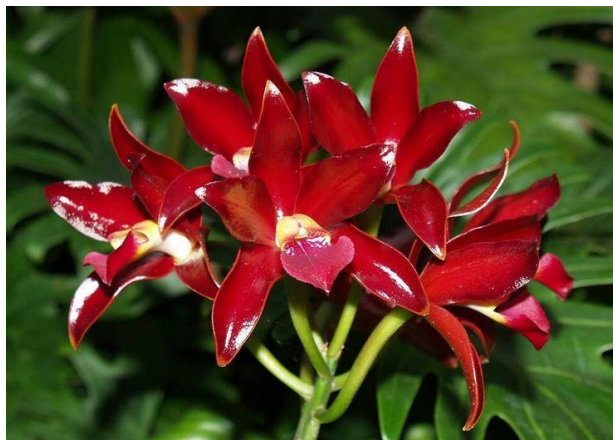
C. Chocolate Drop Pinterest