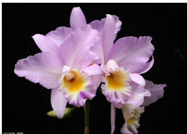
Lc. Puppy Love Santa Barbara Estates