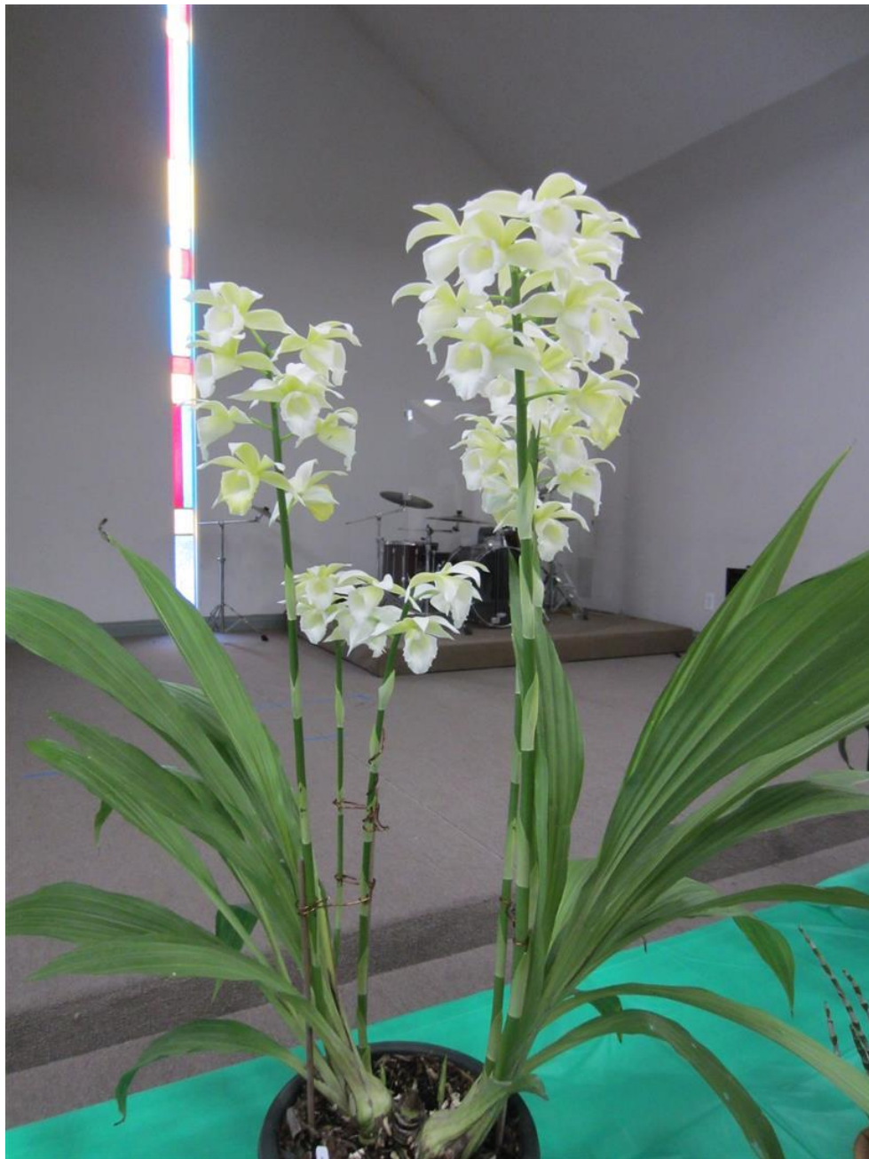
Phaius tankervillae var. alba

Khi cây non đã ra khỏi mắt ngủ và mọc được 2-3 chiếc rễ dài khoảng 2-3 phân, có thể tách ra khỏi củồng hoa và trồng trong chậu. Những cây này phải mất 2-3 năm sau mới ra hoa.