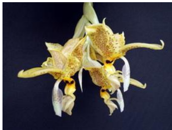
Stanhopea wardii

Thông thường những hoa nào có cánh dày và bóng sẽ lâu tàn hơn là những hoa có cánh mỏng, nhưng cũng có trường hợp ngoại lệ. Ngoài ra thời tiết cũng ảnh hưởng đến sự lâu tàn, nếu giữ hoa ở nhiệt độ 60-65°F (16-18°C) sẽ được lâu hơn ở nhiệt độ 80°F (26°C).