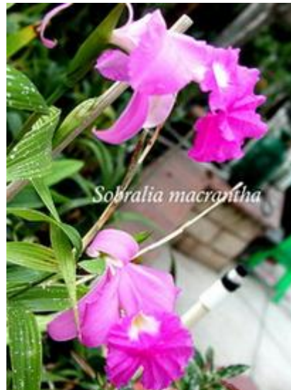
Sobralia macrantha