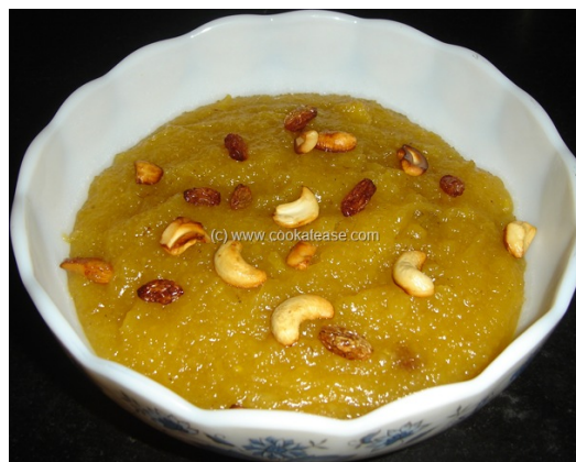
Pineapple kesari www.cookatease.com