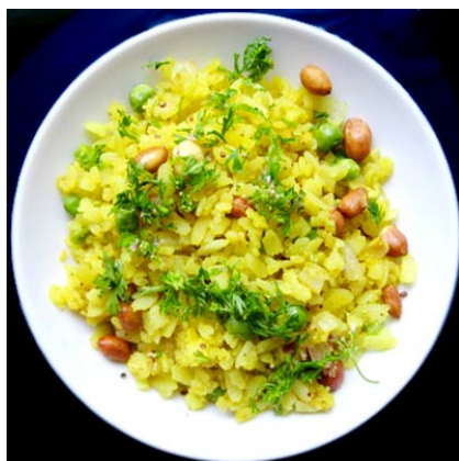
Cary poha upma www.roaringraw.com