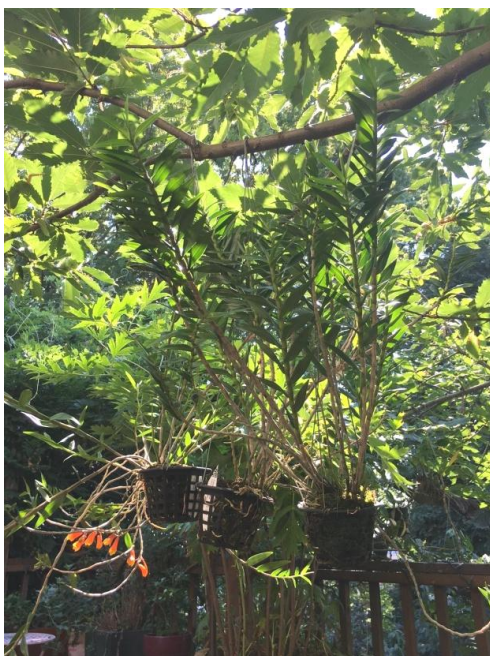
Den. phlox ssp. flammula

Đọc xong mấy giòng phàn nàn về sự thiếu cẩn thận giữa Dendrobium subclausum và Dendrobium phlox của Kew Royal Botanic Gardens , một tổ chức được cả thế giới tôn sùng về những khám phá sưu tầm không những về lan mà về tất cả những thảo mộc khác, tôi thấy buồn cười và lại thấy phục Andy. Tôi chạy qua trang “ Dendrobium phlox ” ngay sau khi đọc được những giòng trên. Ở đó tôi thấy có Dendrobium phlox ssp. flammula , Dendrobium phlox glossy leaf và Dendrobium phlox var. pandanicola .