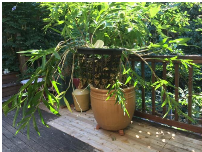
Den. subclausum var. pandanicola

Khi nhận được 2 cây lan này trông chỉ hao hao giống cây đã thấy ở vườn Selby chứ không giống y hệt, cây Dendrobium subclausum var. pandanicola có cành rũ xuống, có cành đứng thẳng, trông éo lá. Cây Dendrobium subclausum var. phlox thì cành thì thấy nhỏ hơn cành của cây kia và có màu tím.