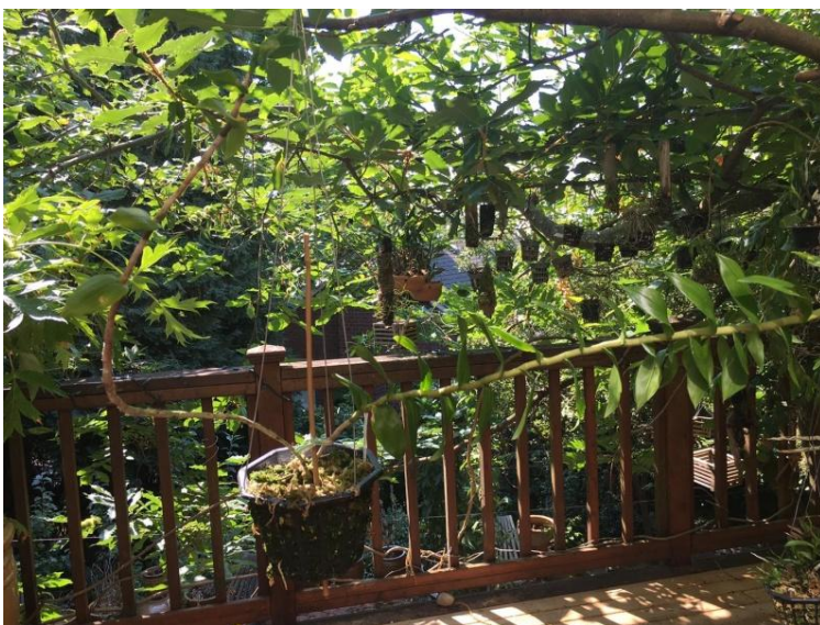
Den. subclausum var. speciosum

Từ đó tôi cứ canh chừng mục Den. subclausum trong catalog của Andy, một lần mua được cây Dendrobium subclausum var. speciosum , nhưng chuyện này hơi thất vọng, vì giá rất đắt, cây để trong giỏ lớn mà chỉ có hai cành, mặc dù cành cao và mạnh, nhưng trông mấy năm rồi mà không thấy nở hoa hay ra cây con như mấy loại kia.