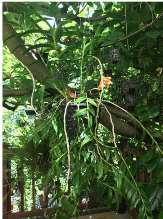
Den. subclausum large leaf pendant

Vài năm sau, tôi thấy xuất hiện trên catalog của Andy's Orchids cây Dendrobium subclausum nguyên văn như sau: " Dendrobium subclausum large leaf pendant form". Tôi đặt mua ngay, khi nhận được cây, tôi mở thùng giấy, bóc hết những giấy bảo lót ra, treo cây lên, tưới nước xong xuôi, đứng ngắm một trận. Nhìn những cành dài, to với những cái lá xanh tươi rũ xuống y hệt như cây lan Giả Hạc đang ra những cành mới vào mùa Hạ thì tôi nhận ra đây mới đúng là cây tôi mong ước 8 năm nay sau y như hệt cây ở Selby Garden. Quá thích thú vì tìm được lan hiếm, tôi gọi Andy đặt mua thêm một cây nữa. Cây sau này không được xum xuê như cây trước nhưng tôi cũng lấy làm vui lắm.