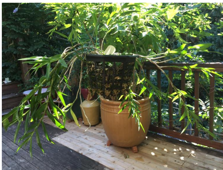
Den. phlox var. pandanicola