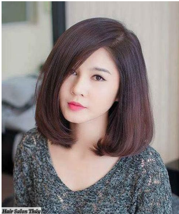
Hair Salon Thúy

Vậy mà sáng Chủ Nhật, ma quỷ xui khiến sao lại dậy sớm, phóng xe tới Hàng Xanh. Hảo ra đón, tóc xõa ngang vai chớ không cắt kiểu demi garcon nữa, mặc áo dài lụa, thấy có dáng thiếu nữ, trông vui tươi, mạnh khỏe và tươi mát như một bông bắp cải mới hái buổi sáng, thấy vậy trong lòng tôi càng tội nghiệp. Hai đứa lên xe, tôi không muốn đi ra phố xá đông đúc, sợ gặp người quen, nên đưa Hảo về vùng quê Thủ Đức ngắm cảnh. Trong lòng nặng nề lắm, cảm thấy vừa có lỗi với người vợ sắp cưới, vừa có lỗi với cô nhỏ này.