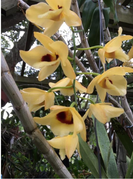
Dendrobium Gattton Sunray

Thì cùng lúc, ông Hà cũng nói chỉ được một tiếng “ Vân ” với một giọng như bị nghẹn. Chắc trên đường đi đến nhà bà Vân ông đã bị choáng ngợp bởi sự bồn chồn, bồi hồi của phút trùng phùng này. Ông bước đến bà Vân, dơ hai tay nắm hai tay của bà, bóp mạnh. Và cứ giữ tay bà như thế, tuồng như muốn lặng lẽ gửi đến cho bà Vân bao sự thương nhớ chất chứa của những ngày tháng cũ.