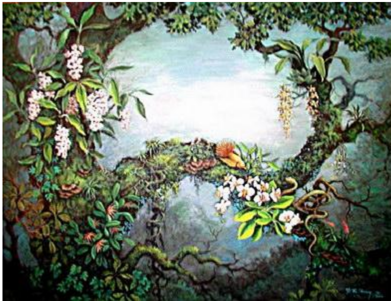
Mừng Xuân Tân Ty Tranh Acrylic 36 x 48"

Vũ bàng hoàng ngây ngất vì hơi men vẫn còn trong miệng, tâm trí còn in sâu dáng vóc ngọc ngà, tai còn văng vẳng giọng nói ngọt ngào thánh thót, nhưng chàng thấy mình nằm bên giòng suối cạn, giữa đám tha ma mộ địa hoang vắng từ lâu.