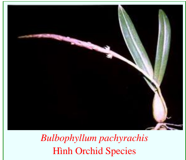
Bulbophyllum pachyrachis

Cây lan này được C.A. Luer ghi nhận trong danh sách các cây lan tại Florida vào năm 1972, nhưng theo tiến sĩ Eric Christenson hiện nay cây Bulbophyllum pachyrachis không những đã được liệt vào hàng các cây hiếm quý (very rare) mà lại không còn tồn tại ở Florida. Nguyên nhân chưa rõ tại sao nhưng chắc chắn không phải là số phận hẩm hiu như những nàng Lan Việt Nam được xuất cảng theo ký lô. Bởi vì hiếm quý cho nên tìm muốn lòi con mắt chỉ thấy hình ảnh trên trang của Internet Orchid Species Photo Encyclopedia mà thôi.