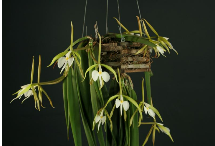
Epidendrum parkinsonianum forum.theorchidsource.com

Ở những bàn bên cạnh các nhà chuyên môn về nước hoa đang bận rộn làm công việc của họ với những cây hoa lan khác nhau. Ngay ở phía bên trái của chúng tôi là ông Katsuhiko Tokuda, một tay kỳ cựu chuyên môn về nước hoa của hãng Shiseido, một công ty mỹ phẩm của Nhật bản, đang ngửi hoa Epidendrum parkinsonianum , loại hoa được thụ phấn bằng một giống bướm đêm. Hoa này thơm ngát về đêm, nhưng ban ngày thì thật là khó để ngửi thấy mùi thơm. Với cánh tay ép chặt vào cạnh sườn, ông Tokuda cúi xuống chiếc hoa như là đang cong người xuống ở thắt lưng, nhưng đứng chân trước chân sau. Ông vừa nhai kẹo cao su dòn dập vừa hít ngất quãng trên những chiếc hoa. Rồi ông bắt đầu kéo lê đôi chân của ông, mới đầu thì chậm chạp, nhưng lúc ông đã bắt được mùi thơm rồi ông trở nên linh động hơn cho đến khi ông phóng tới, rồi phóng lui trước bông hoa giống như một con bọ khổng lồ đang bòn chòn ngửi thử mùi thơm.