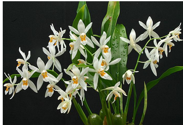
Coelogyne ochracea

“Không có cách nào có thể cứ tiếp tục nghĩ mùi thơm này tới mùi thơm kia mà không nghĩ cả.”