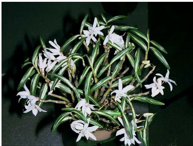
Dendrobium moniliforme Orchids Species.com

Ông Tokuda diễn tả tục lệ cổ truyền của người Nhật dùng mùi thơm của lan To-yo-ran để làm thơm nhà của họ. Những cây lan được đặt trên Tokonoma, cái này giống như một cái bệ được xây cao lên trong những nơi Neofinetia falcata trang trọng ở trong nhà của người Nhật. Cái bệ này là một điểm trọng tâm thẩm mỹ của căn phòng và là nơi để bày những câu đối trên có chữ viết bay bướm và những chậu hoa được trang trí theo kiểu Nhật. Tokonoma thường dùng như một sân khấu trên đó trưng bày những mùa khác nhau, và những chậu hoa lan được bày trên này là Cymbidium faberi và Cymbidium kanran cũng như Dendrobium moniliforme , Neofinetia falcata được diễn tả là thơm như “lily-of-the valley” vào ban ngày và thơm như bánh bơ vào ban đêm, và Calanthe izu-insularis có mùi thơm đậm đà của hoa daphne.