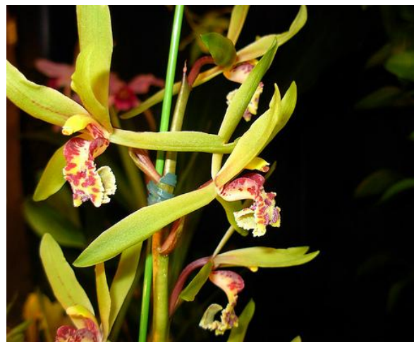
Cymbidium faberi

Tentatrice, tiếng Pháp có nghĩa là “temptress” hay là “người cám dỗ” được làm ra để bắt lấy sự quyến rũ của hoa lan To-yo-ran. Khi ông Tokuda giải thích là tên của loại nước hoa này không phải là ý kiến của ông, một người đàn bà Nhật che miệng cười một cách lễ độ và một người đàn ông khác ở trên bàn họp cười khúc khích một cách khiêm tốn để phụ họa.