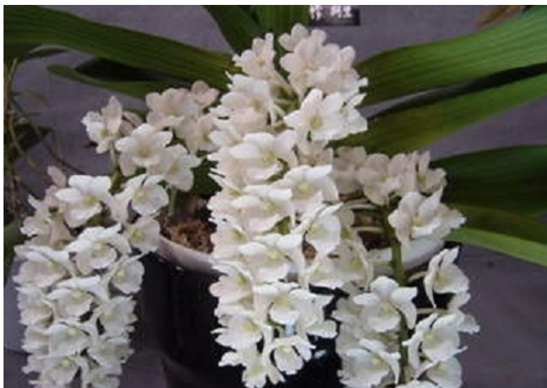
R. gigantea var. alba