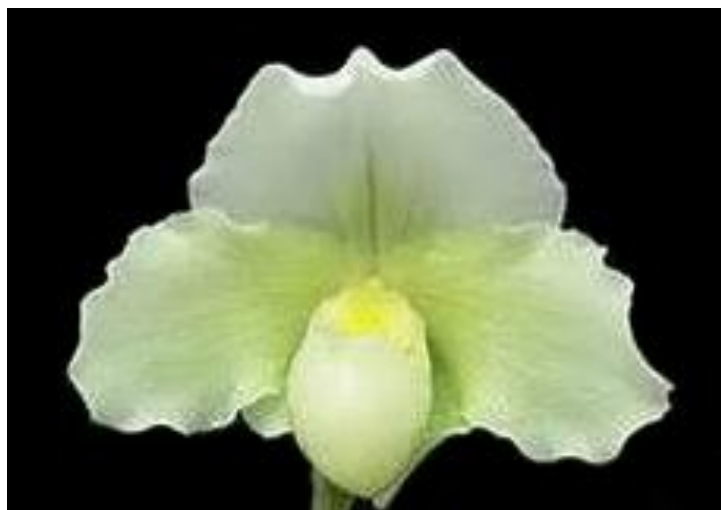
Paphiopedilum White Knight

Gặp bà vào một buổi sáng có những cánh hoa tuyệt thật to lất phất rơi bên ngoài cửa sổ của gian nhà bếp, tôi và bà nhâm nhi tách trà. Bên ngoài, bầu trời xám xịt làm mờ hẳn đi ánh đèn của những chiếc xe đậu ven lề. Đôi vai gầy của bà Eleanor trùm kín với tấm chăn lông màu hồng đào