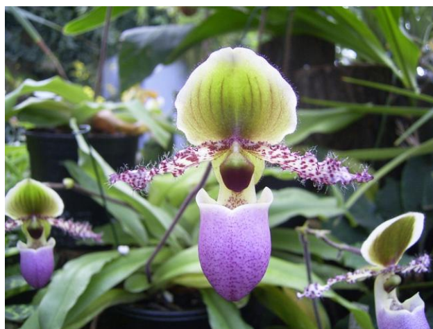
Paph. glaucophyllum var. moquettianum

“ Paphiopedilum glaucophyllum variety moquettianum ,” Randy giông giọng tuyên bố, lập tức cả gian phòng rộn hẳn lên với niềm hân hoan tán thưởng. Những hình ảnh tiếp tục chiếu lên với tên hoa xa lạ vang lên trong sự yên tĩnh đến nỗi tôi có thể nghe được từng tiếng thở mạnh đầu đó. Ông có vẻ hơi kiêu ngạo, nhưng đã giới thiệu mỗi tên bông hoa rất chính xác khiến cho buổi trình bày rất thú vị. Riêng tôi, thực sự khó lòng chú ý đến những cái tên lạ lùng, kỳ bí và màu sắc có đôi chút khác biệt của những bông hoa chỉ vì tôi đang nghĩ đến chữ “French-kiss a bulldog” là làm sao.