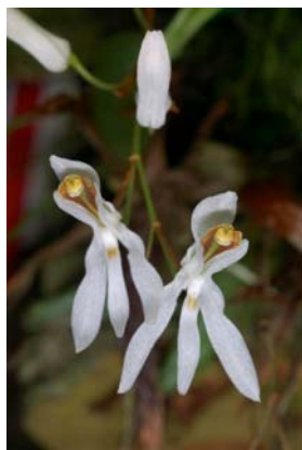
Ảnh: Orchid species

Đồng danh: Coelogyne parviflora Lindl. 1833; *Dendrobium demissum D. Don 1825; Panisea parviflora (Lindl.) Lindl. 1854; Panisea reflexa Lindl. 1854.