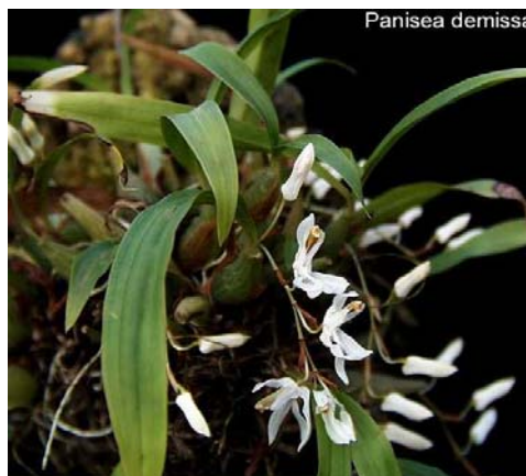
Ảnh: Orchid species