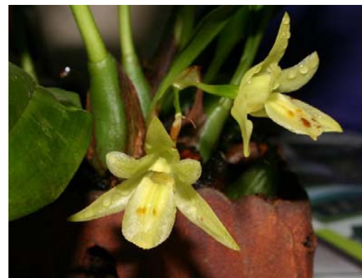
Ảnh: Orchid species

Nơi mọc: Bồ Trạch, Quảng Bình, Lâm Đồng.